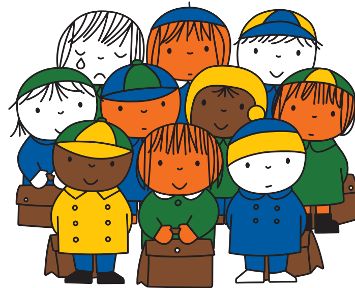
illustratie Dick Bruna © copyright Mercis bv, 1966